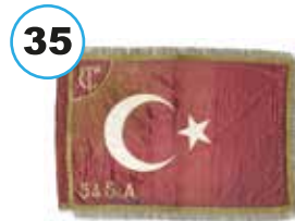
54.Süvari Alayı Sancağı