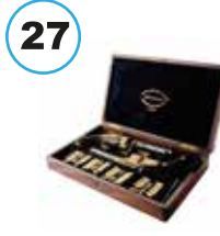
Sultan Abdülaziz'e ait toplu tabanca seti