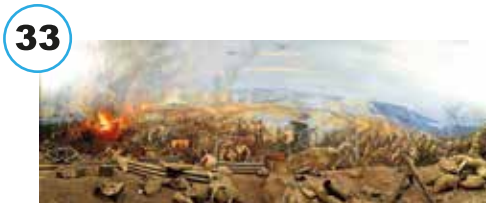
Çanakkale Savaşı Dioraması