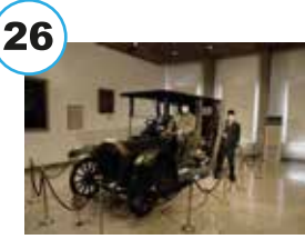
Mahmut Şevket Paşa'nın suikaste uğradığı araba