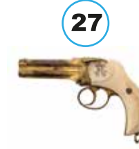
Sultan II. Abdülhamid'e ait tabanca