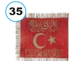
İzmir Halkı tarafından Mustafa Kemal Atatürk'e hediye edilen sancak