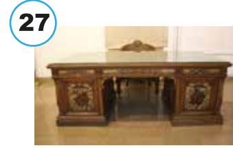
Enver Paşa'ya ait çalışma masası