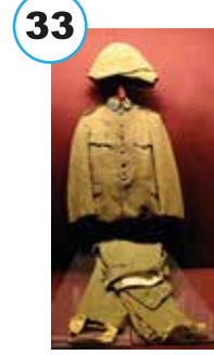
Şehit Yarbay Hüseyin Avni Bey'e ait üniforma