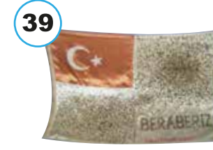
Galatasaray Lisesi öğrencilerinin kendi kanlarıyla oluşturup Kore'deki Türk Birliğine gönderdikleri bayrak