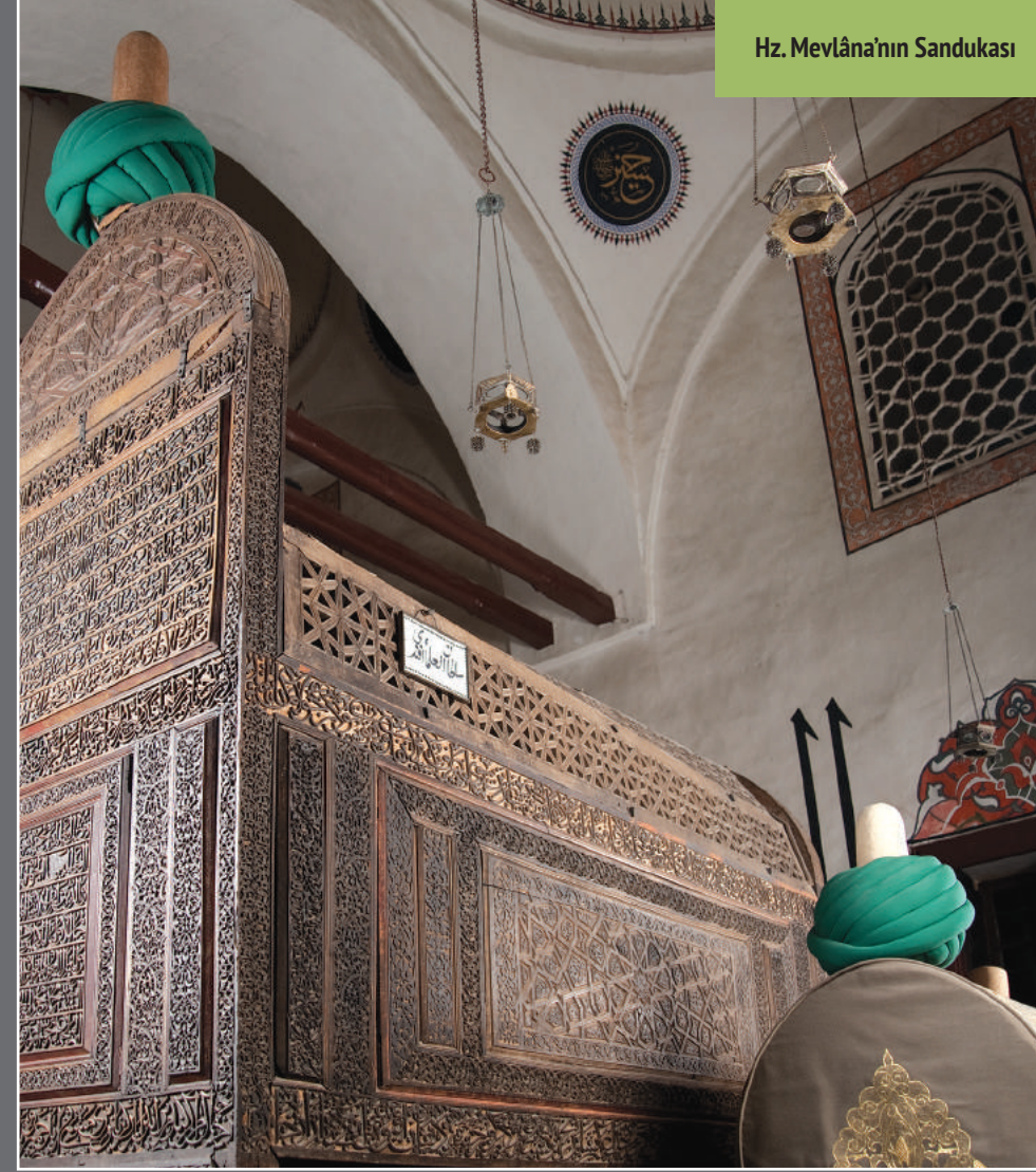
Hız. Mevlâna'nın Sandukası

Cumhuriyetin ilânından sonra 1925 yılında diğer tekkeler gibi kapatılan Konya Mevlâna Dergâhı, 1926 yılında Atatürk'ün isteği üzerine Konya Âsâr-ı Atîka Müzesi olarak ziyarete açılmıştır. 1954 yılında yeni bir düzenleme ile Mevlâna Müzesi adını almıştır.