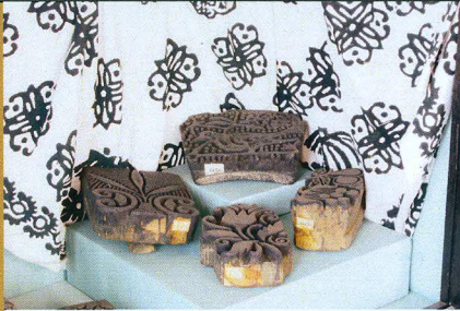
Taş Baskı Kalıpları