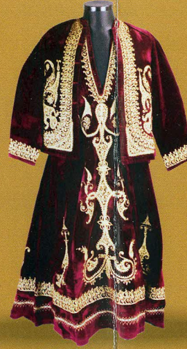
İşlemeli Entari-İşlemeli Hırka- 20. yy

Gelen ziyaretçiler bu katta haremlik - selamlık bölümlerini, paşayı, hanımını, gelinlerini, oğullarını o zamanki kıyafetleri ve kullandıkları eşyaları mankenlerle desteklenmiş şekilde görebilirler.