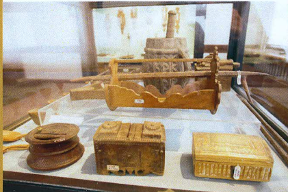
Ahsap Kahve Kutuları