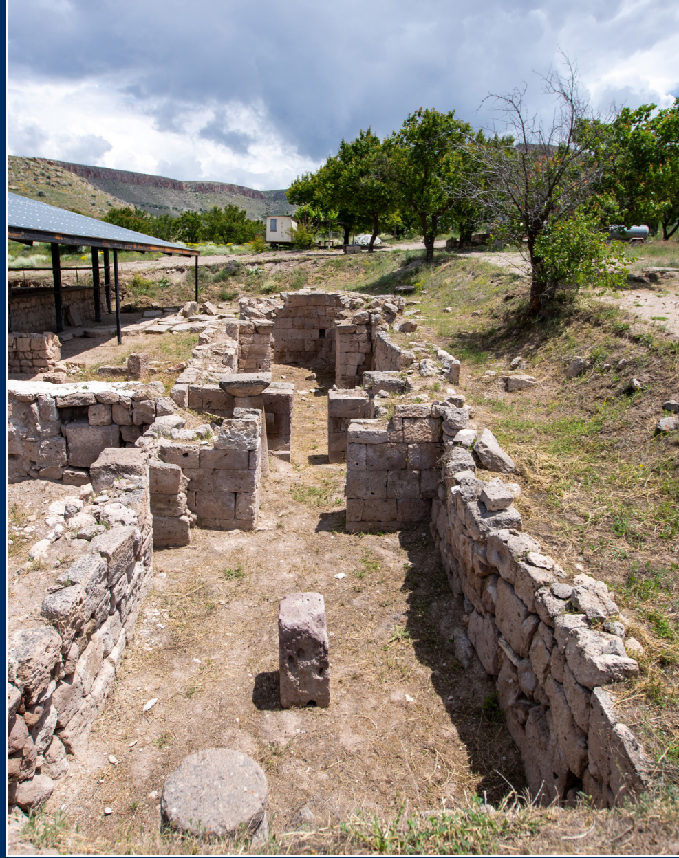
Kapadokya'nın kadim tarihinde, Geç Roma-Erken Hıristiyanlık dönemlerini kapsayan Sobesos antik kentinde 1400 yıllık Hıristiyanlık dini inanç ve öğretilerinin gerçekleştirildiği şapel ziyaretçilerini bekliyor.