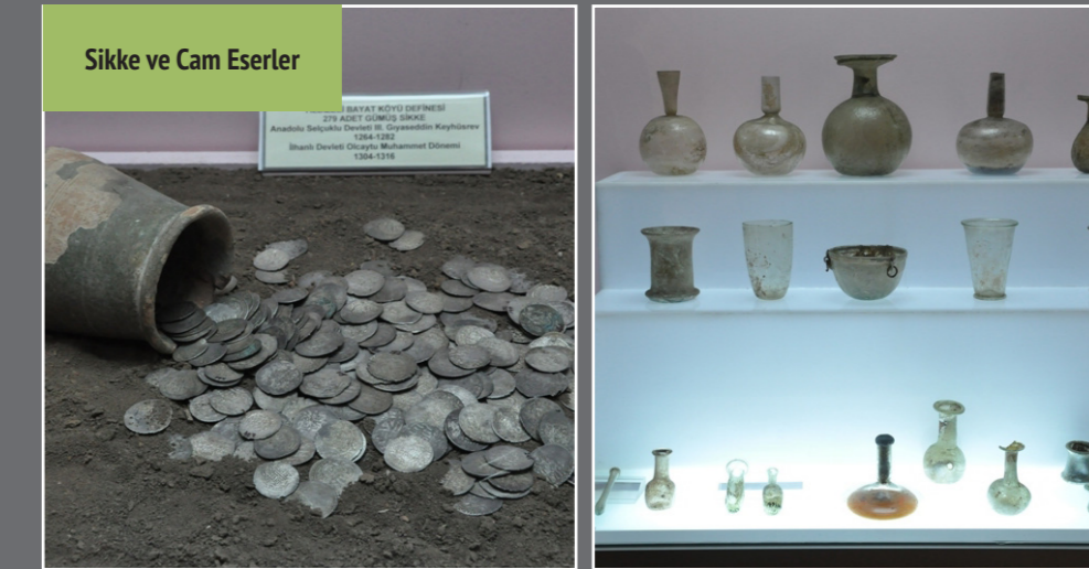
Sikke ve Cam Eserler