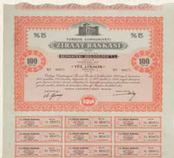
Türkiye Cumhuriyeti Ziraat Bankası'nın kuponlu %5 faizli istikrazı

The National Import and Export Incorporated Company of Turkey's bond dated 1922.