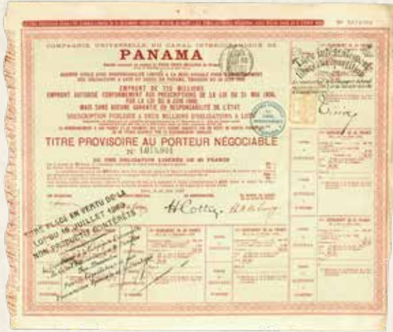
Canal Interocéanique de Panama Şirketi'nin 1888 senesinden bir borç senedi

A debt bond from the Canal Interocéanique de Panama Company issued in 1888.