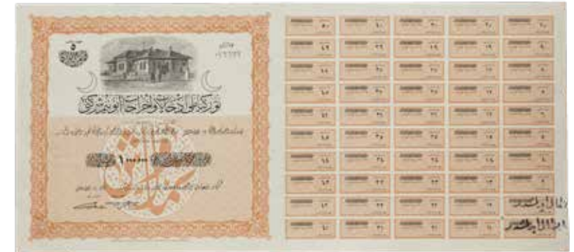
Türkiye Milli İthalat ve İhracat Anonim Şirketi tarafından 1922 senesinde çıkarılmış bir hisse senedi.

İttihad Incorporated Company's debt bond dated 1911 with a total value of 250.000 Liras.