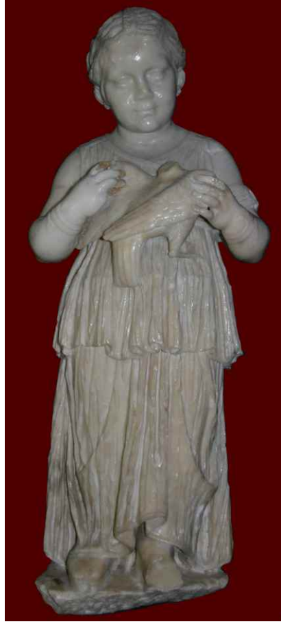
Kuşlu Kız Heykeli Roma Dönemi

Antik Likya Bölgesi'nin en batısındaki şehir olan Telmessos'un üzerine kurulmuş Fethiye'de, ilk müze çalışmaları, 1957 yılı depreminden sonra, yeniden yapılanan kent ve çevresinden toplanan eserler ile oluşturulmaya başlanmıştır. Müzemiz 1987 yılından bu yana ziyarete açıktır.